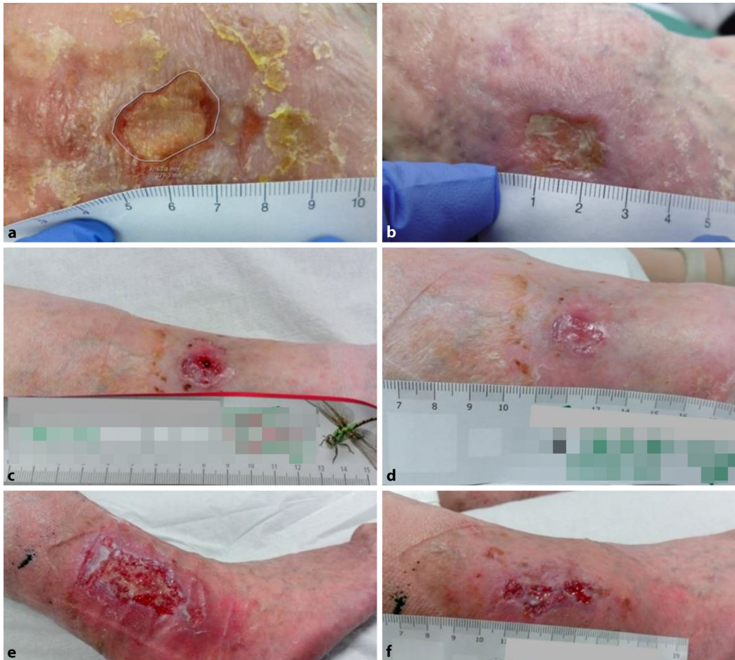
Abb. 1 ◀ Behandlung verschiedener Wunden mit Enzym-Alginogelen. a Venös-arterielles Ulcus cruris vor der Behandlung und b nach 2-wöchiger Behandlung. c Infiziertes Hämatom nach Sturz: Wunde vor Behandlungsbeginn und d nach 1-wöchiger Behandlung. e Ulcus cruris venosum vor der Behandlung und f nach 18-tägiger Behandlung

[5, 7, 33]. Geringe Konzentrationen genügten, um klinisch relevante antibiotikaresistente Bakterienstämme abzutöten, ein zytotoxischer Effekt auf Keratinozyten und Fibroblasten blieb aus.