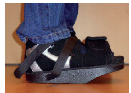
Abbildung 1 Vorfußentlastungsschuh im Stand.

Zwei Aspekte sind bei der Anwendung eines Vorfußentlastungsschuhs zu beachten. Der Vorfußentlastungsschuh führt nicht zu einer vollständigen Entlastung des Vorfußes, sondern setzt eine Teilbelastbarkeit voraus (Tab. 1) und der Vorfußentlastungsschuh bedarf einer besonderen Gehweise, um die Entlastung des Vorfußes